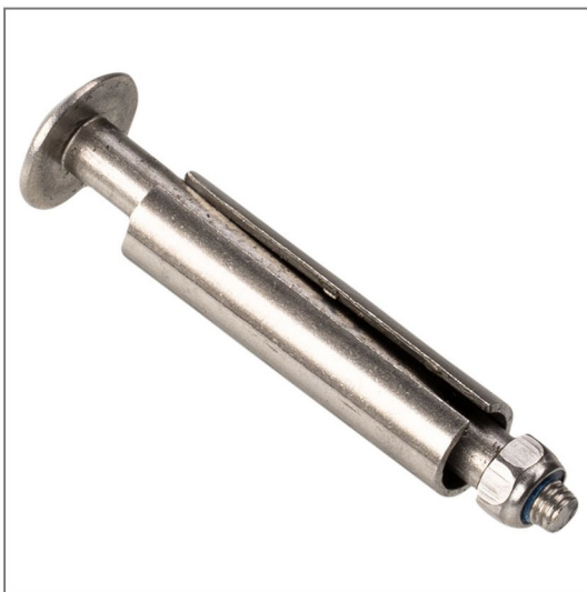
Befestigungsschrauben in der Hülle, mit Auszug-Stopp