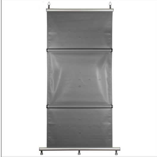
Aufgerollter Rollschutz inklusive Verstärkungsrohren