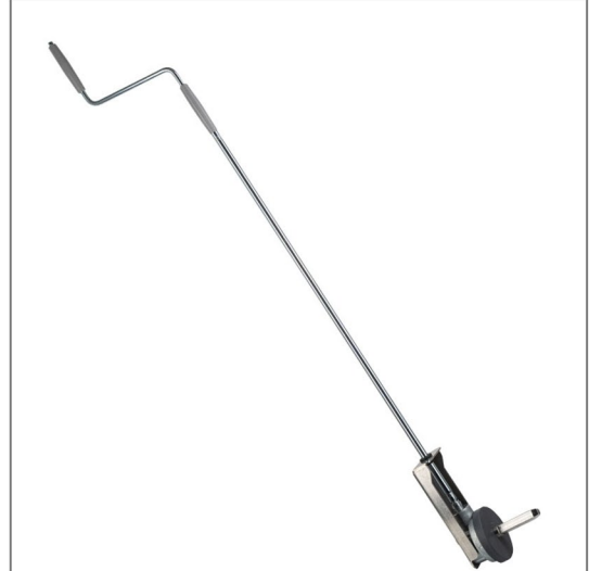
Kurbel mit Übersetzung zum Aufrollen der Rollschutz-Abdeckung