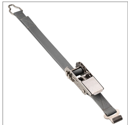
Befestigungs-Gurte mit Edelstahl-Komponenten (erfüllt die französische Norm NF P 90-308)